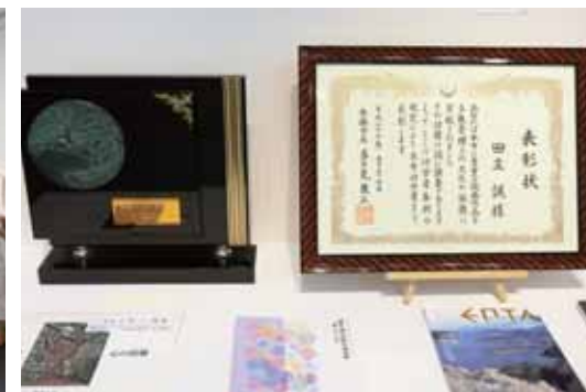
舞鶴市功労者 表彰