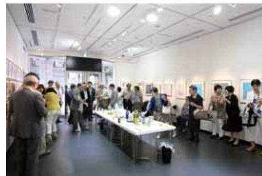
オープニングパーティーの様子