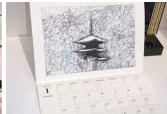
来年のカレンダー 販売